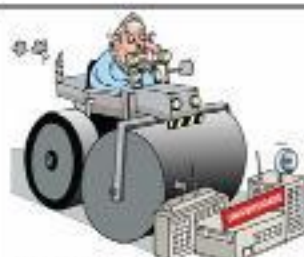
Projetos de Lula atacam a educação pública para favorecer as instituições privadas.

ponha em cheque a questão de qual classe deve deter o poder político na sociedade. Como já dissemos, consideramos fundamental que sejam os trabalhadores aqueles no poder, como forma de garantir que os frutos do trabalho sejam revertidos em melhorias nas áreas de educação, saúde, moradia, transporte e etc. Isso é algo que nenhum governo de aliança com empresários e banqueiros pode ser capaz de fazer, como bem demonstrou o governo de Lula e PT nos últimos 8 anos.